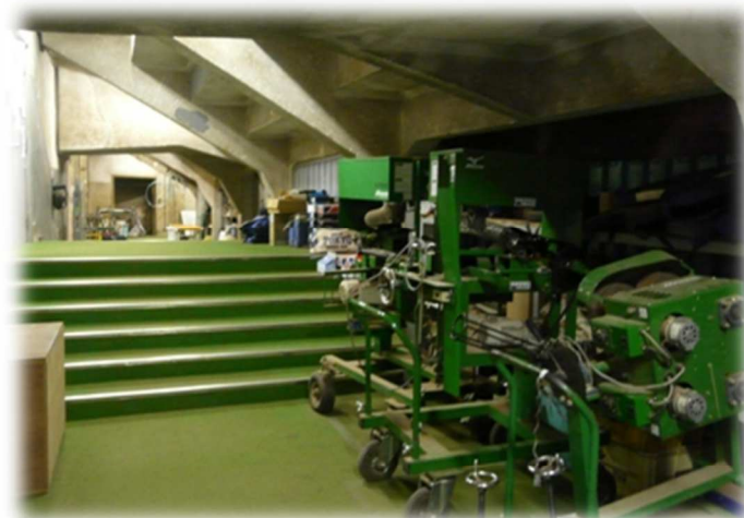
↑スタンド下。奥にはトレーニングルーム、学年部屋等があります。