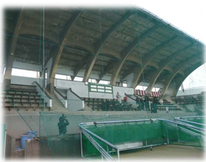
↑スタンド。オープン戦等はこちらのスタンドでご観戦いただけます。

文化財登録に際しまして、去る2月21日に東大球場にて記念式典が行われました。今回は、その記念式典の様子を、東大球場の紹介とともにお送り致します。